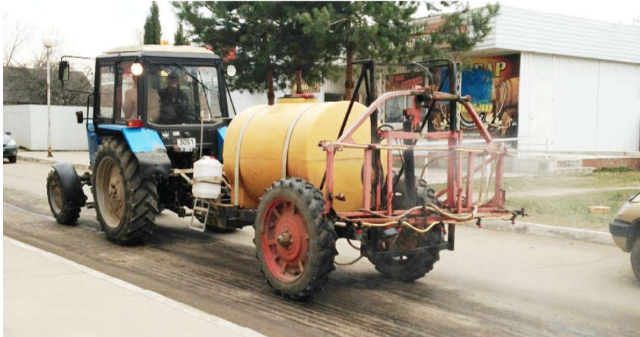
график влажных уборок. Предложено увеличить объем предупреждающей информации по коронавирусу, непрерывно вести работу с жителями, направленную на соблюдение режима самоизоляции.

Представителями штаба по защите населения от коронавирусной инфекции проведена проверка исполнения мер по борьбе с распространением вируса.